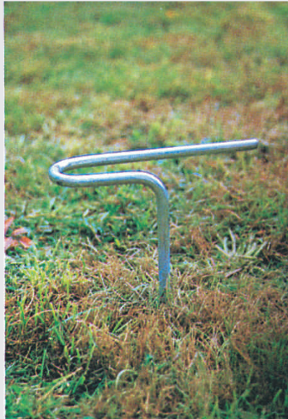
Netzniederhalter, feuerverzinkt · hold-down clamp