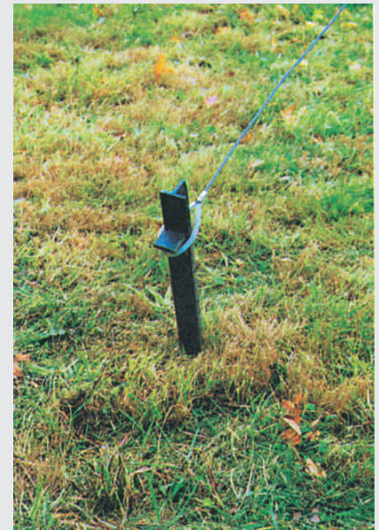
Hering und Seil · peg and rope