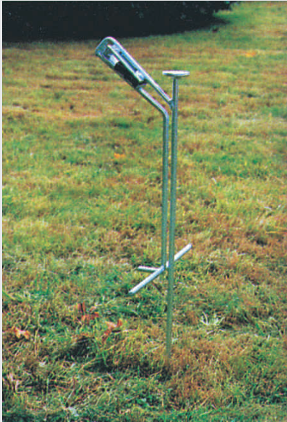
Haltepfosten, feuerverzinkt · Support post, galvanized